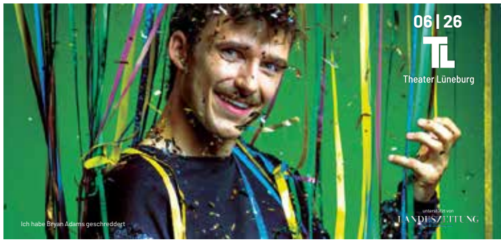
Ich habe Bryan Adams geschreddert